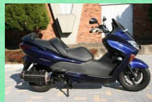
熱電発電マフラーを搭載したオートバイ。

内部摩擦による非破壊評価技術の開発 転位と不純物原子の相互作用 金属間化合物の力学特性評価 熱電材料の高温強度特性の評価